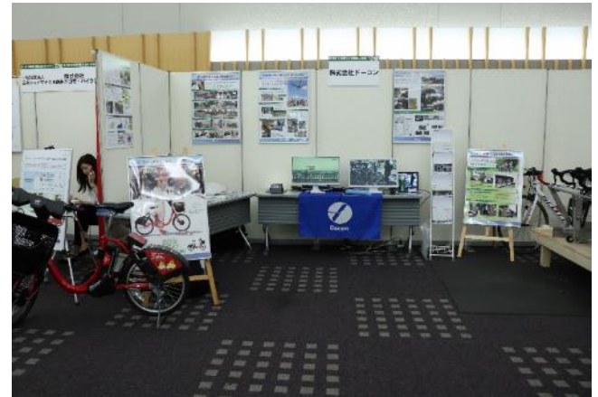
【参考】「第9回自転車利用環境向上会議 in さいたま」での企業団体展示ブースの様子