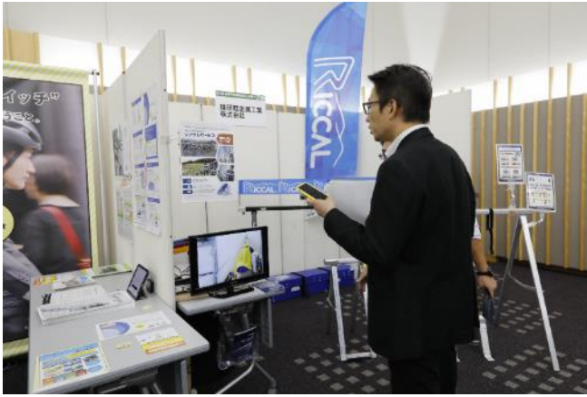
【参考】「第8回自転車利用環境向上会議 in 北海道・札幌」での企業団体展示ブースの様子